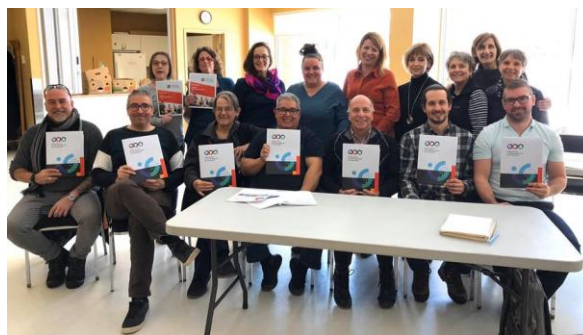
Atelier sur le Portrait des communautés Centre communautaire de Buckingham 17 février 2020

Le tout premier atelier a eu lieu à Buckingham pour les acteurs de la Basse-Lièvre.