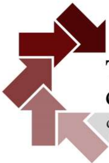
Table de développement social de la Basse-Lièvre